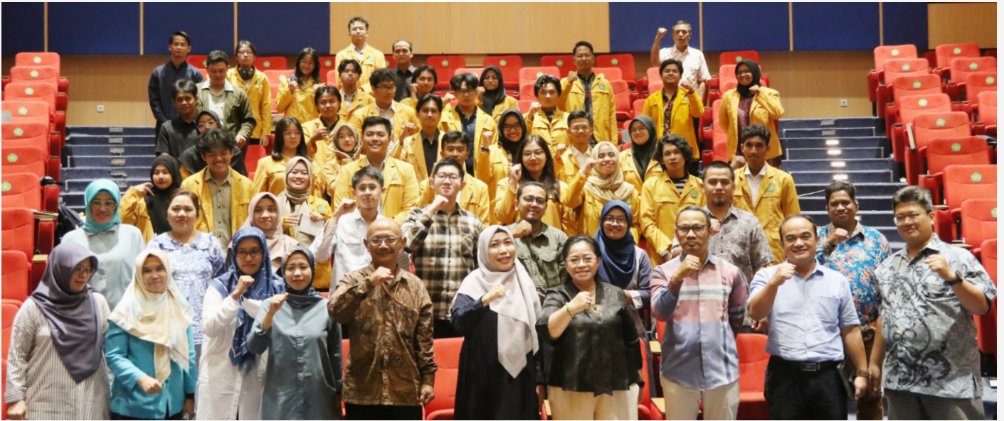
Kepala Biro Akademik dan Kemahasiswaan (keempat dari kanan) melakukan foto bersama peserta NUDC universitas mulawarman di Gedung Prof. Masjaya pada Rabu (26/03/2024)