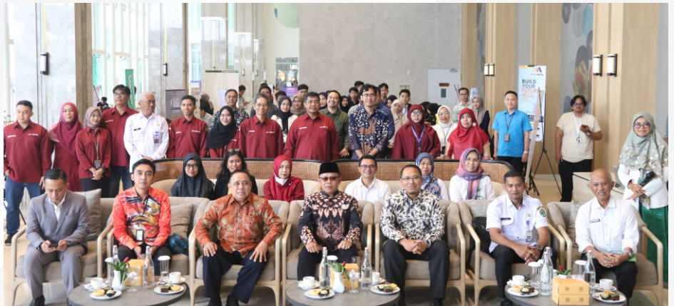
Rektor (keempat dari kanan, Wakil Rektor III (ketiga dari kiri) serta Kepala Pusat Pasar Kerja (Pasker ID) berfoto bersama peserta dan mitra pada Gelaran Job Fair Batch 1 2024 di Hotel Mercure, Samarinda, Kamis - Jumat (28-29/2/2024). Job Fair Batch 1 Tahun 2024 diikuti oleh 40 perusahaan/mitra dan total pendaftar pencari kerja sebanyak 1.053 orang.

Universitas Mulawarman (UNMUL) melalui Unit Pelaksana Teknis (UPT) Pengembangan Karir dan Kewirausahaan (Perkasa) menyelenggarakan Job Fair Batch 1 Tahun 2024. Kegiatan ini dilaksanakan di Lobby Hotel Mercure, yang diselenggarakan selama 2 hari (28-29/2/2024).