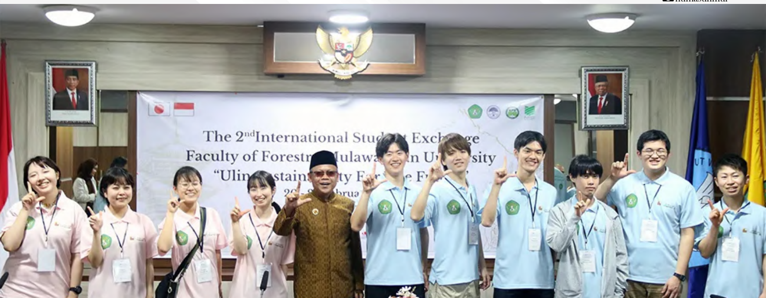
Rektor(kelima dari kiri) melakukan sesi foto bersama 11 mahasiswa Student Exchange yang berasal dari Kyoto University Jepang bertempat di Ruang Rapat Satu, Lantai Tiga Rektorat UNMUL pada Selasa (20/2/2024)