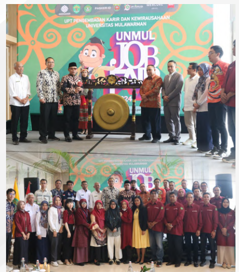
foto (pertama) Rektor, wakil rektor III, kepala pusat pasar kerja (pasker id) beserta perwakilan mitra membuka pagelaran unmul job fair batch 1 2024, foto (kedua) Rektor, wakil rektor III, Kepala pusat pasar kerja (pasker id) beserta perwakilan mitra dan panitia melakukan foto bersama