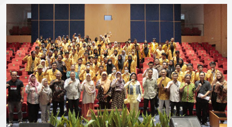
Pada akhir sesi acara pada minggu (24/03/2024) peserta, juri dan penyelenggara melakukan foto bersama pada kegiatan seleksi ONMIPA tingkat universitas

Lebih lanjut, Dr. Aditya, juga memberikan apresiasi kepada seluruh peserta yang bersedia untuk ikut serta dalam lomba ONMIPA-PT dan berharap peserta yang ikut pada seleksi ada yang bisa lolos di tingkat wilayah dan lanjut ke Nasional. “Prestasi tidak akan tercapai jika tidak ada daya juang yang sungguh-sungguh dalam diri sendiri,” ungkap Dr. Aditya yang menyemangati peserta yang ikut dalam seleksi ONMIPA-PT UNMUL tersebut.