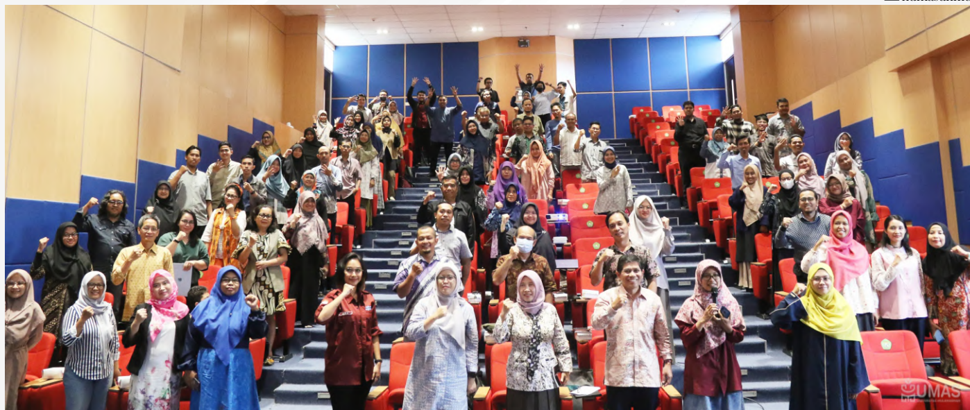
Wakil Rektor III (ketiga dari kanan) melakukan sesi foto bersama peserta Praktisi Mengajar (PM) Angkatan 4 2024, Gedung Ilab Universitas Mulawarman pada Rabu (27/03/2024).