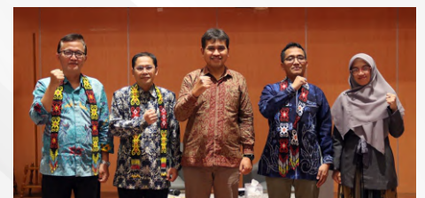
Ketua LP2M UNMUL (tengah) Foto bersama 3 pemateri yang berasal dari universitas-universitas yang ahli di bidangnya

Semua pembicara dalam Coaching Clinic memberikan penekanan untuk mengangkat kasus yang berada di sekitar masyarakat, sehingga dari penelitian yang dilakukan diharapkan dapat memberikan kontribusi langsung kepada lingkungan atau masyarakat yang menjadi objek penelitian karena ini merupakan salah satu poin penilaian dalam assessment proposal bantuan Hibah DTRPM.