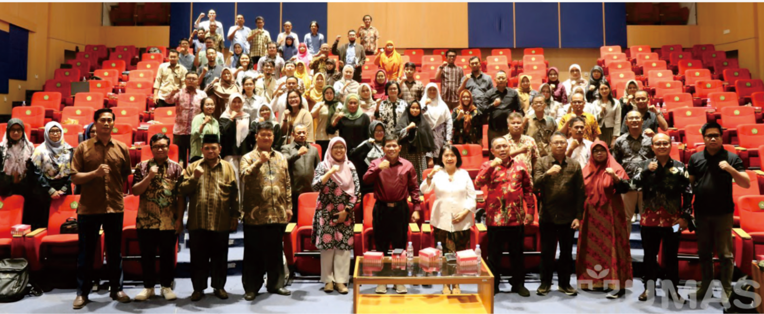
Wakil Rektor I, Wakil Rektor II, dan Wakil Rektor III (tengah) berfoto bersama peserta Workshop PKM dan PPK Ormawa di Gedung Prof. Masjaya, Samarinda, Selasa (6/2/2024) Kedepannya di harapkan memanfaatkan potensi yang kita miliki sehingga bisa melakukan riset yang baik untuk bidang eksakta dan humaniora