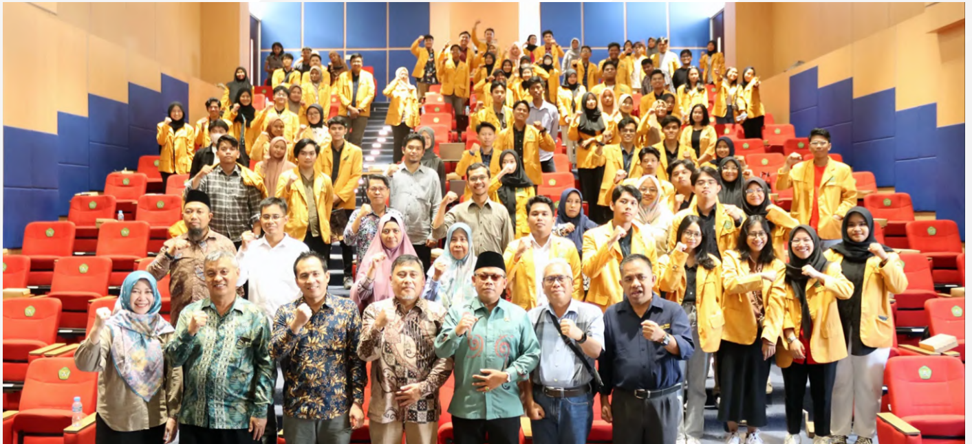
Rektor(ketiga dari kanan) melakukan foto bersama peserta MSIB Batch 6 UNMUL di Gedung Prof. Dr. H. Masjaya pada Rabu (21/2/2024).