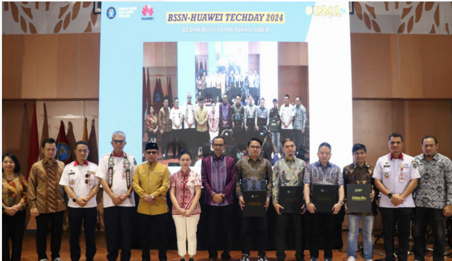
Rektor(kelima dari kiri) bersama Director-Government Affairs, PT. Huawei Tech Investment(keenam dari kiri) melakukan foto bersama pada acara Bedah Buku Komunikasi Siber yang di Gelar Bersama BSSN dan Huawei yang dilaksanakan di Gedung Prof Masjaya Universitas Mulawarman pada Selasa (19/03/2024).